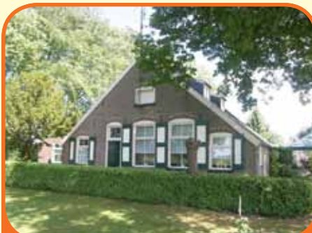
WIJHE, Elshofweg 4

Royaal vrijstaand woonhuis, bj. 1992, met garage/berging (met zolderberging), carport en 535 m 2 grond. Kenmerken: L-kamer met eikenhoutenvloer, erker en schouw met houtkachel, woonkeuken met inbouwapparatuur en schuifpui, 3 slaapkamers, badkamer met douchecabine, wastafelmeubel en 2e toilet, hobbykamer. € 379.000,-- k.k.