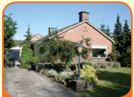
HEINO, Woolthuisweg 24

Semi-bungalow, bj. 1965, met garage (30 m 2 ) en 1.092 m 2 grond. Kenmerken: woonkamer met schouw en terrasdeur, keuken met inbouwapparatuur, kelder, 3 slaapkamers, badkamer met ligbad, douchecabine en vaste wastafel, grote bergzolder. Bouwvergunning aanwezig voor een garage/carport van 100 m 2 .