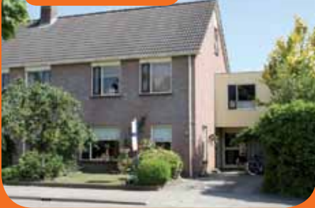
RAALTE, Rietzanger 2

Royaal helft van dubbel woonhuis (1989) met garage. Gekenmerkt door ruimte en licht maar ook door de vrije ligging. Tuin onder architectuur aangelegd op een kavel van 283 m 2 . De woning heeft o.m. L-vormige woonkamer met tuindeuren, halfopen keuken ('06), 5 slaapkamers en badkamer ('07).