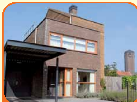
RAALTE, Molenweg 22

Vrijstaand woonhuis met bijbehorende schuren op ca. 0.50.00 ha grond. Meer grond bij te koop tot 6.96.00 ha. Kenmerken: woonkamer met eiken parketvloer, woonkeuken met inbouwapparatuur, bijkeuken, kelder, serre, badkamer met douche, toilet en wastafelmeubel, 4 slaapkamers (1 op begane grond), vrij gelegen. € 465.000,-- k.k.