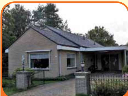
LEMELERVELD, Prins W. Alexanderstr. 4

Vrijstaande uitgebouwde semi-bungalow, bj. 1960-2002, met carport, inpandige garage/berging, vrijstaande houten garage en 923 m 2 grond. Kenmerken: tuingerichte woon- en eetkamer, woonkeuken met inbouwapparatuur, 3 slaapkamers en badkamer op begane grond, op verdieping meer (slaap)kamers mogelijk.