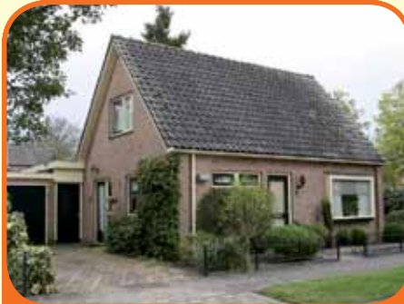
HEINO, Eijsinckstraat 2

Vrijstaande bungalow, bj. 1965, met garage/schuur en 399 m 2 grond. Kenmerken: L-kamer met tuindeur, keuken, badkamer met douche-cabine, vaste wastafel en ligbad en slaapkamer op begane grond, 2 slaapkamers op verdieping, buitenschilderwerk van 2010, mooi aangelegde onderhoudsvriendelijke tuin.