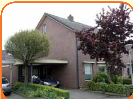
HEINO, Lijsterbes 11

Uitgebouwd helft van dubbel woonhuis, bj. 1981, met berging, carport en 259 m 2 grond. Zeer geschikt voor senioren vanwege slaap- en badkamer op beg. grond! Kenmerken: woonkamer-/slaapkamer, serre, open luxe keuken met inbouwapp., badk., op verd. 3 slaapk. en 2e badk., op 2e verd. o.a. 4e slaapk.. € 272.500,-- k.k.