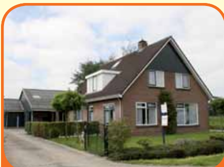
LAAG ZUTHEM, Hagenweg 19

Zeer landelijk gelegen royaal vrijstaand woonhuis (720 m 3 ), bj. 1970, in 1998 in zijn geheel verbouwd, met 9.050 m 2 grond. Paardenstal ingericht met 5 boxen, een zadelkamer, werkplaats en hooiopslag, kapschuur en rijbak, afm. 20 x 40 meter, met lichtmasten. Kenmerken: 4 slaapkamers, luxe woonkeuken, bijkeuken.