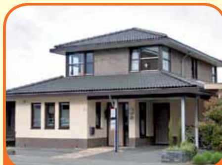
RAALTE, Collendoorn 3

In fraaie wijk 'Het Overstigt' gelegen modern vrijstaand woonhuis, bj. 2005, met carport en 346 m 2 grond. Kenmerken: tuingerichte Z-vormige woonkamer, moderne open keuken met complete inbouwapparatuur, 5 slaapkamers en 2 badkamers w.v. 1 slaapkamer met aansluitende badkamer op de beg. grond.