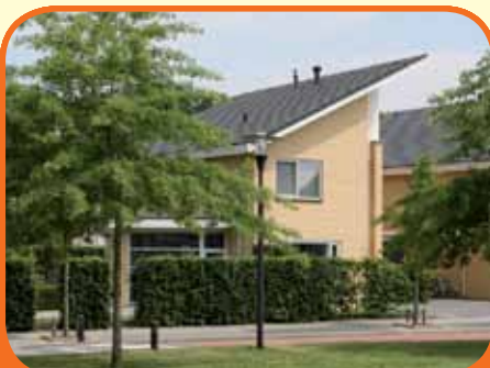
RAALTE, Twickel 17

Modern en uitstekend onderhouden royaal uitgebouwd geschakeld vrijstaand woonhuis (770 m 3 ) met vrij uitzicht gelegen, bj. 2001, met garage, carport en 458 m 2 grond. Kenmerken: royale L-kamer met schuifpui, luxe woonkeuken, eet-/speelkamer, 3 slaapkamers, luxe badkamer, werkruimte en zolderberging.