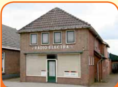
HEETEN, Dorpsstraat 46

Vrijstaand woonhuis, oorspronkelijk bj. 1956, verbouwd en vergroot in 1974, met garage (60 m 2 ) met kelder, carport, schuur en 1.177 m 2 grond. Diepe tuin op het westen. Kenmerken: winkelruimte (40 m 2 ), kantoor, woonkeuken, woonkamer, verdieping 5 slaapkamers en badkamer. In centrum gelegen.