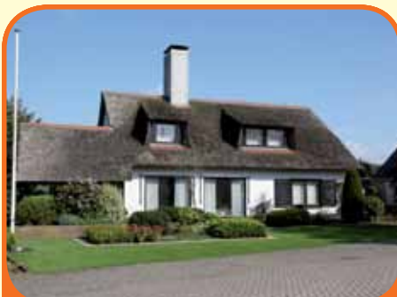
RAALTE, Spinhuisstraat 40

Vrijstaand rietgedekt landhuis, bj. 1973, met garage, carport, fraai ingerichte wellnessruimte met binnenzwembad (afm. 4 x 10 meter) en badkamer, rietgedekte veranda en 932 m 2 grond. Kenmerken: woonkamer met gashaard en eethoek, gesloten woonkeuken, 5 slaapkamers (1 op beg. grond) en 2e badkamer.