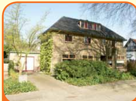
WIJHE, Stationsweg 50

Karakteristieke vrijstaande dorpsvilla, bj. 1933, met royale garage, veranda en 380 m 2 grond. Gelegen op loopafstand van station en centrum. Kenmerken: souterrain (75 m 2 ), fraaie hal met bordestrap, woonkamer (40 m 2 ), luxe open keuken, bijkeuken, werkkamer, 4 slaapkamers verdieping, ruime zolder.