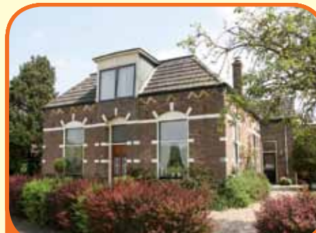
HEINO, Stationsweg 9c/11

Op unieke locatie aan de rand van het dorp en toch nabij centrum, schitterend vrij gelegen herenhuis , bj. 1910, met vrijstaande garage (5x6 meter), schuur (7x5 meter) en 1.792 m 2 grond. De naastgelegen kavel behoort tot het object waardoor de tuin schitterend rondom en op het zuidoosten is georiënteerd.