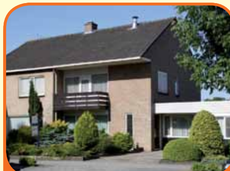
RAALTE, Westdorplan 18

Geschakelde twee-onder-een-kap-woning, bj. 1971 en 338 m 2 grond. Kenmerken: keuken (bj. 2001) met inbouwapparatuur, doorzonkamer, royale werk/hobbykamer (ca. 24 m 2 en slaapkamer mogelijk), 3 slaapkamers (1 met balkon), badkamer (bj. 1971), zeer royale zolderberging (extra slaapkamers mogelijk).