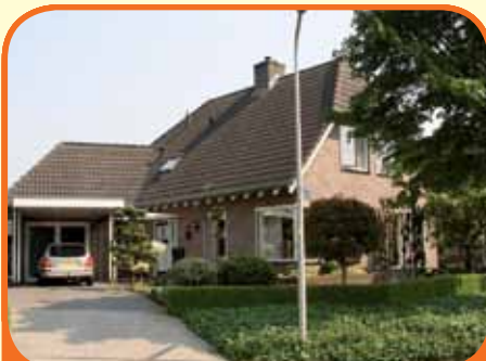
HEETEN, Nienenhof 92

Royaal helft van dubbel woonhuis, bj. 1984, met veranda, garage, tuinkas en 449 m 2 grond. Brede zijtuin met mogelijkheden voor parkeren, stalling, carport etc. Kenmerken: L-vormige woonkamer, luxe open keuken met inbouwapparatuur, 3 slaapkamers, ruime badkamer, zolder (4 e kamer mogelijk). € 279.000,-- k.k.