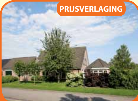
RAALTE, Putter 2

Vrijstaand woonhuis, bj. 1989, met garage, berging/prieeel en 968 m 2 grond. Kenmerken: werkkamer, luxe open keuken, bijkeuken, royale L-kamer, royale serre, 4 slaapkamers, badkamer met bad, douchecabine, toilet en vaste wastafel. Op fraaie locatie aan een rustige weg, gehuld in veel grond gelegen.