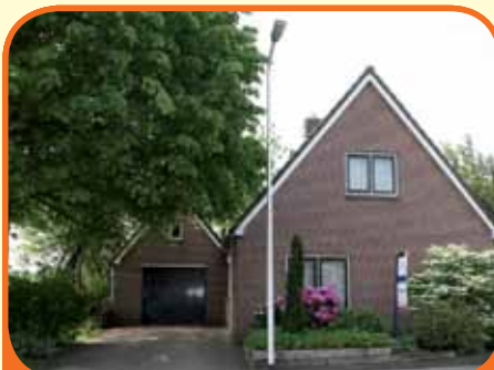
LIERDERHOLTHUIS, Herenbrinksweg 5a

Uitgebouwd helft van dubbel woonhuis, bj. 1981, met berging, carport en 259 m 2 grond. Zeer geschikt voor senioren vanwege slaap- en badkamer op beg. grond! Kenmerken: woonkamer-/slaapkamer, serre, open luxe keuken met inbouwapp., badk., op verd. 3 slaapk. en 2e badk., op 2e verd. o.a. 4e slaapk.. € 272.500,-- k.k.