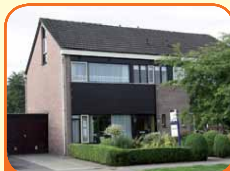
WIJHE, Disselhof 4

Royaal helft van dubbel woonhuis, bj. 1976, met garage en 284 m 2 grond. Verzorgde tuin (zuiden) met veel privacy. Kenmerken: doorzonkamer, open keuken, 4 ruime slaapkamers, royale badkamer, bergruimte met combi-ketel (2003). Dak- en muurisolatie en gedeeltelijk dubbele beglazing.