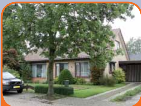
RAALTE, Halewecstraat 4

Vrijstaand woonhuis, bj. 1972, met garage/berging (ca. 35 m 2 ) en 626 m 2 grond. Kenmerken: L-kamer met gashaard en schuifpui naar het terras, gesloten keuken met eenvoudige inrichting, badkamer met douche en vaste wastafel, bijkeuken, op verdieping 2e toilet en 3 slaapkamers. Centrum op loopafstand.