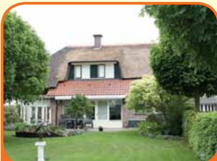
WIJHE, Engeweg 1

Riet gedekt landhuis, bj. 1990 en vergroot in '04, met riante serre (ca. 26 m 2 ), schuur met paardenboxen, royale garage/werkplaats en 4.775 m 2 grond. Kenmerken: woonkamer, open keuken (bj. '07) met inbouwapp., slaap- en badkamer op beg. grond, 3 slaapkamers op verd. Wijhe 6,5 km en Raalte 5,5 km.