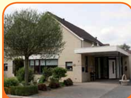
RAALTE, Tulpenstraat 2c

Helft van dubbel woonhuis met slaap- en badkamer op de begane grond, bj. 1996, met berging, carport en 266 m 2 grond. Kenmerken: woonkamer met gashaard en schuifpui, open keuken met inbouwapparatuur, op verdieping 2 slaapkamers en berging. Centrumvoorzieningen en NS-station op loopafstand.