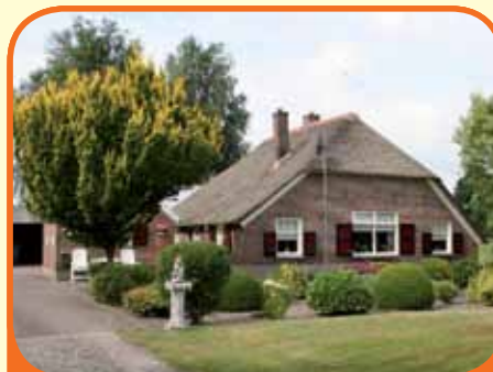
RAALTE, Hogeweg 27

Fraai gelegen vrijstaande rietgedekte woonboerderij, bj. ca. 1900, met diverse schuren en ca. 3.000 m 2 grond (meer grond bespreekbaar). Kenmerken: douche, gesloten keuken, woonkamer, slaapkamer en hobbyruimte (deel), verwarming dmv losse kachels, centrum Raalte op 2 km!