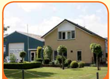
RAALTE, Wechelerweg 22

Moderne bedrijfswoning met vrij uitzicht en een inpandig bereikbare vrijstaande hal (240 m 2 ), bj. 1997, gelegen op 1.068 m 2 grond. Kenmerken: woonkamer (ca. 36 m 2 ), moderne keuken met inbouwapparatuur, serre, werkruimte, 4 slaapkamers en badkamer. Hal met showroom en voldoende parkeerplaatsen.