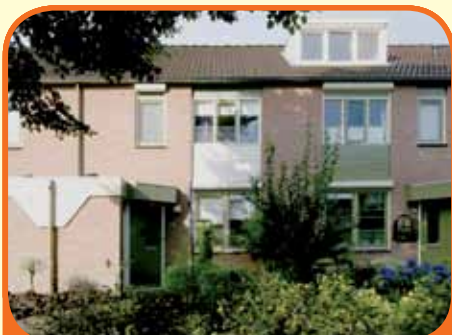
RAALTE, Ekster 78

Tussenwoning, bj. 1989, met schuur en 128 m 2 grond. Kenmerken: toilet (bj. '10), tuingerichte woonkamer met houten vloer, open keuken (bj. '01) met inbouwapparatuur, 3 slaapkamers en badkamer (bj. '02) met ligbad, douche, 2e toilet en wastafelmeubel, royale zolderberging (extra slaapkamer mogelijk).