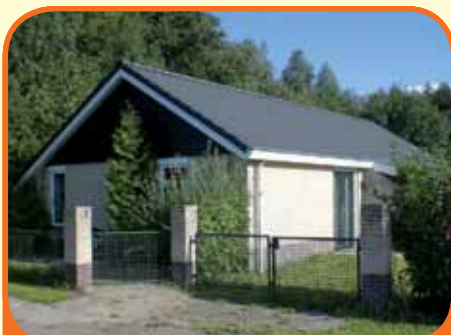
HEINO, Zwolseweg 71a bungalow 68

Op recreatiepark 'Park old Heino' gelegen vrijstaande recreatiewoning, bj. 2004, met 1.397 m 2 eigen grond. Vanaf de veranda heeft u een fraai uitzicht over royale zonnige tuin. Kenmerken: badkamer met douchecabine, badkamermeubel en 2e toilet, tuingerichte woonkamer met open keuken, 3 slaapkamers.