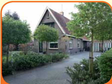
WESEPE, Weth. M. van Doorninckweg 24

Fraai aan de rand van 120 hectare bos gelegen vrijstaand woonhuis, bj. 1935, met garage, fraaie veranda (20 m 2 ) en circa 550 m 2 grond. Nagenoeg geheel gemoderniseerd in 2005. Kenmerken: woonkamer, royale woonkeuken met inbouwapparatuur, bijkeuken, 4 slaapkamers, badkamer, zolderberging.