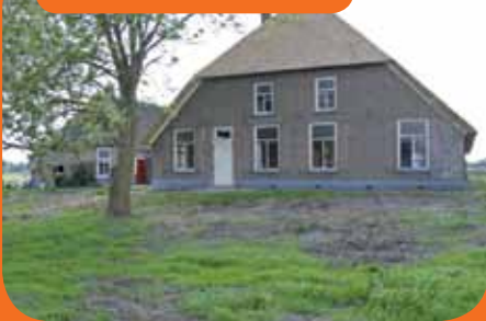
OKKENBROEK, Oosterhuisweg 7

Op de historische plek d' Oale Krieger worden momenteel 3 woningen met liefde en passie voor oude materialen in oude eer hersteld: 1 vrijst. woonboerderij € 449.000,-- k.k. (casco) en een helft van een woonboerderij, zowel voorhuis € 449.000,-- k.k. (afgebouwd) als het achterhuis (reeds verkocht).