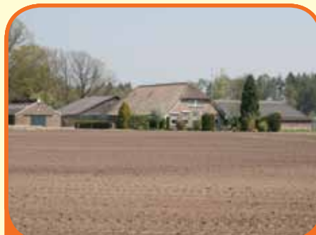
WESEPE, Velsdijk 4

Fraai gelegen goed onderhouden woonboerderij, bj. 1933, met schuren, buitenbak en 15.005 m 2 grond. De woonboerderij is geschikt voor particuliere bewoning. Boerderijsplitsing, deelname aan Rood voor rood regeling en/of VAB-regeling e.d. behoren tot de nader uit te werken mogelijkheden.