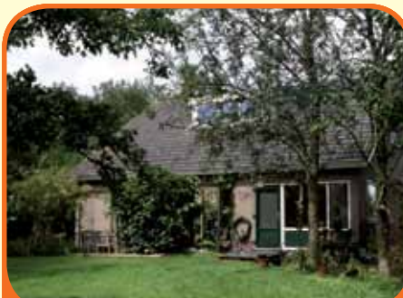
OLST, Fortmonderweg 45

Op unieke locatie middenin natuurgebied 'De Duursche Waarden' en grenzend aan de IJssel gelegen vrijstaand woonhuis, bj. 1976, met bijgebouwen, paardenstal (afm. 10 x 3.5 m) en 6.300 m 2 grond. Kenmerken: woonkamer, woonkeuken, 2 slaapkamers en badkamer be-gane grond, 2 slaapkamers verdieping.