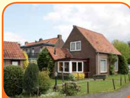
WESEPE, Scholtensweg 39

Vrijstaand woonhuis, bj. 1955, met garage, schuur en 745 m 2 grond. De zeer diepe tuin is op het westen gelegen. Kenmerken: doorzonkamer, gesloten keuken, bijkeuken met plaats c.v.-ketel (bj. 2008), eenvoudige doucheruimte en separaat toilet, 2 slaapkamers (beide met inloopkast).