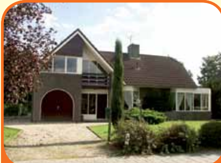
WIJHE, Enkweg 91

Royale vrijstaande woning, bj. 1987, met inpandige garage en grote carport aan de achterzijde van de woning met 1.260 m 2 grond!. De tuin is rondom gelegen en aan de achterzijde zeer vrij. Kenmerken: hal met vide, woonkamer met rookkanaal en schuifpui, woonkeuken, bijkeuken, 3 slpkms, grote badkamer.