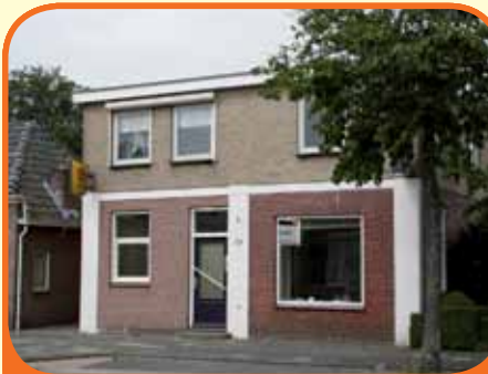
HEINO, Dorpsstraat 79

Vrijstaand woon-/winkelpand, bj. 1930, verbouwd in 1966, met garage, schuur en 360 m 2 grond. Kenmerken: woonkamer/winkel (23 m 2 ), badkamer met douche, toilet en wastafelmeubel, woonkamer (15 m 2 ), woonkeuken met inbouwapparatuur, bijkeuken, douche, 4 slaapkamers, in het centrum gelegen.