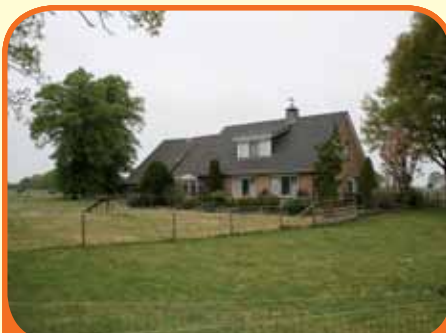
HAARLE, Poggenbeltweg 10

Recentelijk gerenoveerde en gemoderniseerde vrijstaande woning, oorspr. bj. 1937, met vrijstaande garage/werkplaats, priël, zwembad (4 x 8 m) en 881 m 2 grond. Kenmerken: woonkamer, woonkeuken, kelder, werkkamer, slaapkamer begane grond, 2 slaapkamers en badkamer verdieping, zolder. € 375.000,-- k.k.