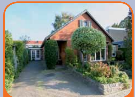
RAALTE, Haverstraat 2

Sfeervol vrijstaand woonhuis (semi-bungalow), bj. 1963, met praktijk/kantoor/werkruimte (ca. 19 m 2 ), veranda en 526 m 2 grond. Kenmerken: woonkamer met erker en serre, uitgebouwde woonkeuken met inbouwapparatuur en openslaande deuren, slaap- en badkamer op begane grond, 3 slaapkamers op verdieping.