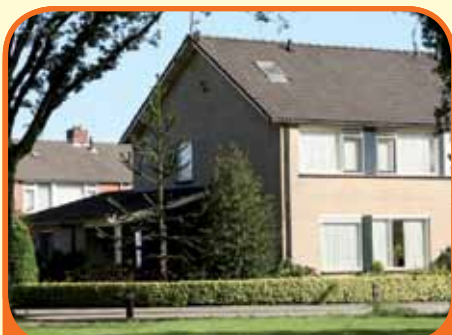
RAALTE, van der Wijkstraat 29

Uitgebouwd helft van dubbel woonhuis, bj. 1971, met vrijstaande garage en 318 m 2 grond. Tuin met veranda en buitenberging gelegen op het oosten. Kenmerken: L-vormige woonkamer, gesloten keuken, aangeb. bijkeuken met toilet, 4 slaapkamers, badkamer met douche, vaste wastafel en 2e toilet, nabij centrum.