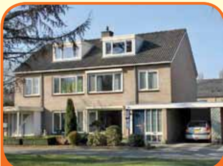
RAALTE, Larixplein 11

Helft van dubbel woonhuis, bj. 1973, met garage, carport en 241 m 2 grond. Fraaie tuin met veranda. Kenmerken: Z-kamer met eiken parket, gesloten keuken met inbouwapparatuur, 3 slaapkamers (1 met balkon), badkamer met douche, vaste wastafel en toilet, royale hobby-/slaapkamer, rustig aan plein gelegen.