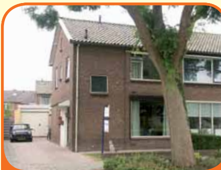
OLST, Thorbeckestraat 8

Uitgebouwd helft van dubbel woonhuis, bj. circa 1962, met garage en 203 m 2 grond. Aan de voorzijde uitzicht op openbaar groen. Kenmerken: woonkamer met uitgebouwde open keuken met inbouwapparatuur, 4 slaapkamers, nette badkamer met douchecabine, wastafelmeubel en 2e toilet, bergkamer.