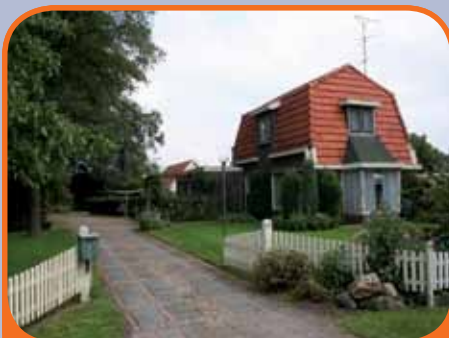
HEINO, Lemelerveldseweg 33

Vrijstaand woonhuis, bj. ca. 1935 (belangrijk vergroot en verbouwd in 1973), met fraaie hobbyschuur/atelier, garage, carport en 3.270 m 2 grond. Riante tuin met wandelbos. Kenmerken: woonkamer, woonkeuken, slaap- en badkamer op beg. grond, 2 slaapkamers op verdieping. Net buiten Heino (2 km) gelegen.