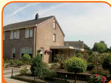
WIJHE, De Lange Slagen 27

Vrijstaand woonhuis, bj. 1980, met garage (v.v. zolder) en 310 m 2 grond. Vrij en weids uitzicht over de groene landerijen rondom. Kenmerken: woonkamer met openhaard, extra slaap- en badkamer op begane grond, keuken, bijkeuken, 2 slaapkamers en 2e badkamer op verdieping, aan rand van dorp gelegen. € 269.000,-- k.k.