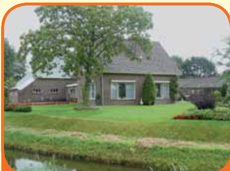
OLST, Wijheseweg 2

Tussen Olst en Wijhe gelegen vrijstaande woning, bj. 1969, met diverse nette, multifunctionele schuren en ca. 8.500 m 2 grond (mogelijkheid tot het vergrootten naar 4 hectare). Kenmerken: woonkamer, woonkeuken, slaap- en badkamer begane grond, 3 slaapkamers verdieping, 2 zolderkamers.