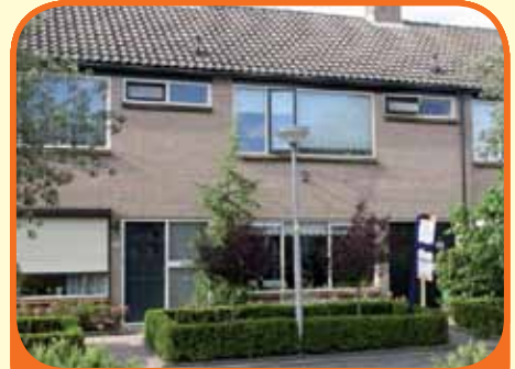
HEETEN, Vredeveldstraat 10

Moderne tussenwoning, bj. 1974, met aangebouwde berging/bijkeuken en 147 m 2 grond. Fraai aangelegde tuin met achterom. Kenmerken: doorzonkamer (30 m 2 ) met eiken houten vloer, dichte keuken met inbouwapparatuur, 4 slaapkamers, badkamer met douche en wastafelmeubel en op verdieping separaat 2e toilet.