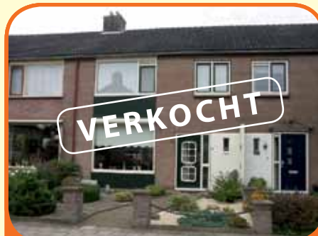
WIJHE, Tuurweide 16

Op loopafstand van de IJssel gelegen goed onderhouden tussenwoning, bj. circa 1970, met stenen berging en 145 m 2 grond. Kenmerken: doorzonkamer, luxe dichte keuken met inbouwapparatuur, 4 slaapkamers, nette badkamer, ruime zolder. Toepassing van dubbel glas in kunststof kozijnen.