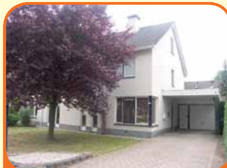
WIJHE, Ereprijs 31

In het buitengebied van Wijhe in de buurtschap Elshof gelegen halfvrijstaande woonboerderij bj. 1915 met circa 10.000 m 2 grond. Kenmerken: woonkamer, dichte keuken, 5 slaapkamers, berging. Het onderhoud van de woning is belangrijk achterstallig. Gedeeltelijk renovatie is nodig. € 275.000,-- k.k.