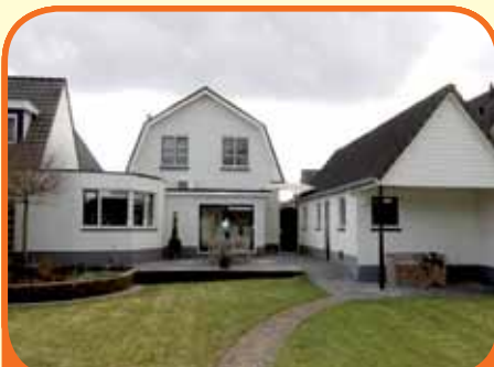
OLST (DEN NUL), Houtweg 21

Royaal helft van dubbel woonhuis, bj. 1993, met garage, carport en 315 m 2 grond. Op korte afstand van speelgelegenheden, kinderboerderij en bos gelegen. Kenmerken: L-vormige woonkamer, moderne open keuken, bijkeuken, 3 slaapkamers (4e kamer mogelijk), complete badkamer, veel bergruimte. € 289.000,-- k.k.