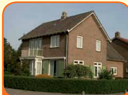
OLST, Ds. K. Terpstrastraat 17

Fraai op loopafstand van het centrum en NS-station gelegen karakteristiek vrijstaand woonhuis, bj. 1957, met garage en 444 m 2 grond. De tuin is rondom gelegen, zeer vrij uitzicht door ligging op hoek. Kenmerken: royale hal/entree, kelder, woonkamer (40 m 2 ) met open haard, 3 slaapkamers.