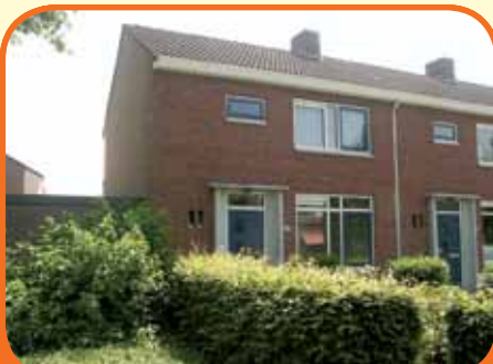
OLST, Thorbeckestraat 84

Gerenvoerde hoekwoning, bj. 1966, met vrijstaande stenen berging en 124 m 2 grond. Tuin gesitueerd op het zuiden. Kenmerken: doorkamer, dichte keuken, 3 slaapkamers, gerenoveerde badkamer, zolder. Toepassing van dak-, muur- en vloerisolatie alsmede geheel dubbele beglazing.