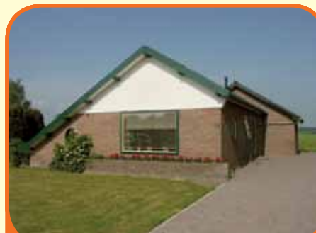
OLST, Rijkstraatweg 99

Nabij de uiterwaarden van de IJssel gelegen vrijstaande bungalow met ca. 12.200 m 2 grond. Het perceel grenst direct aan een schitterende kolk met privé-strandje. Bijbouwen bijgebouwd tot 140 m 2 toegestaan. Kenmerken: ruime woonkamer, keuken, bijkeuken, 3 slaapkamers, badkamer, grote zolder.