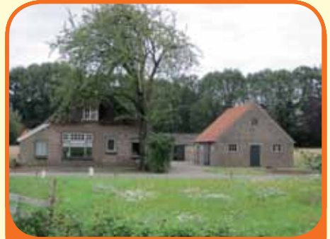
LEMELERVELD, Heideparkweg 14

Woonboerderij, bj. 1910, met ca. 3.500 m 2 grond. Kenmerken: woonkeuken met eenvoudig keukenblok, woonkamer met schouw en gashaard, 3 slaapkamers, douche en voormalige deel, de naastgelegen schuren worden afgebroken, renovatie is noodzakelijk, de fraaie locatie leent zich uitstekend voor nieuwbouw.