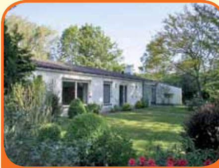
HEINO, Stationsweg 18

Nabij het centrum van Heino (> 500 m) schitterend vrij gelegen semi-bungalow, bj. 1965, met garage, carport, schuur en 1.820 m 2 grond. Fraai aangelegde tuin met meerdere terrassen rondom. Kenmerken: L-kamer met openhaard, terrasdeuren en schuifpui, woonkeuken, 4 slaapkamers en 2 badkamers.