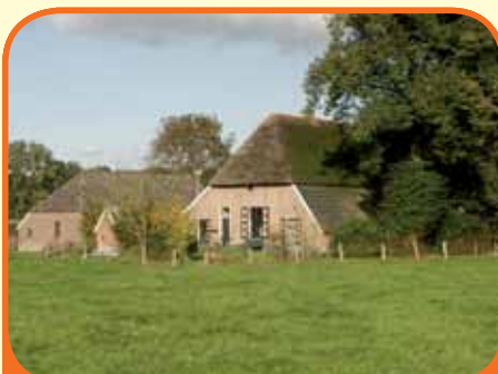
OLST, Spijkerbospad 5

Op Landgoed Spijkerbosch naast Huis 'Spijkerbosch' gelegen karakteristieke vrijstaande boerderij met aangebouwde schuur, kapschuur en ca. 10.000 m 2 eigen grond (géén erfpacht) . Kenmerken: gewelvenkelder, woonkamer met schouw, originele tegelwand en bedsteden, achterhuis (ca. 200 m 2 ).