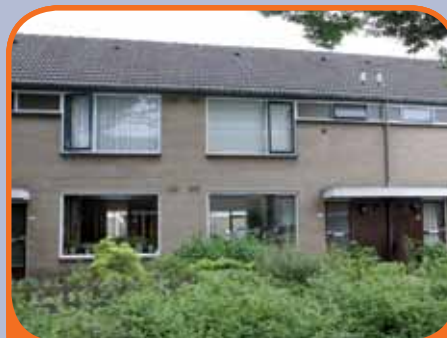
RAALTE, Beukensingel 116

Tussenwoning, bj. 1973, met berging en 168 m 2 grond. Tuin op het westen. Kenmerken: doorzonkamer, gesloten keuken met toegang tot de tuin, 4 royale slaapkamers (1 met groot dakvenster) en badkamer met douche, vaste wastafel, 2e toilet en aansluiting voor wasmachine/droger, nabij centrum gelegen.