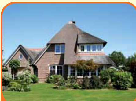
RAALTE, Raarhoeksweg 8

Onder architectuur gebouwde riante rietgedekte villa (975 m 3 ), bj. 2002, met garage/berging en 854 m 2 grond. Kenmerken: kelder, royale zonnige living, woonkeuken met inbouwapparatuur, slaap- en badkamer op beg. grond, op verd. o.a. 5 slaapkamers en 2e badkamer, op 2e verd. twee royale zolderbergingen.