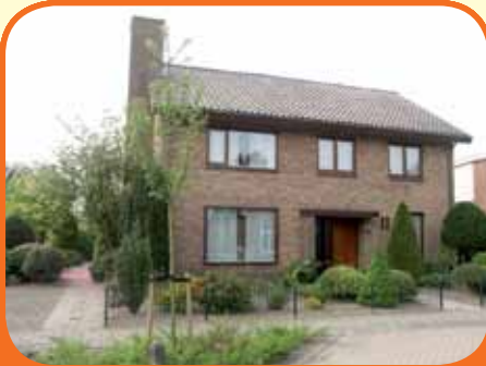
OLST, Boskamp 38

Zeer royaal vrijstaand woonhuis (645 m 3 ), bj. 1974, met grote garage (ca. 40 m 2 ) en een zeer vrije kavel van 940 m 2 grenzend aan de weilanden! Verzorgde tuin met blokhut (12m 2 ). Kenmerken o.a.: royale living, dichte keuken, kelder, bijkeuken, 6 slaapkamers, royale zolder.