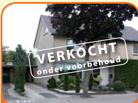
NIEUW HEETEN, Timmermansstraat 15

Helft van dubbel woonhuis, bj. 1972, met carport en een fraaie kantoor/hobby- of praktijkruimte en 312 m 2 grond. Kenmerken: doorzoonkamer, gesloten eenvoudige keuken, 4 slaapkamers en badkamer (bj. 2005) met o.a. douchecabine en wastafelmeubel. De woning is v.v. dubbel glas en kunststof kozijnen.