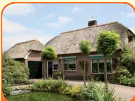
HAARLE, Raamsweg 14

Vrijstaande rietgedekte bungalow, bj. 1984, met garage, buitenzwembad (afm. 4 x 7 meter en 1.20 meter diep) en ca. 575 m 2 grond. Kenmerken: woonkamer, open keuken, slaapkamer, badkamer (bj. 2004) en op verdieping slaapkamer met balkon (meerdere kamers mogelijk), centrum van Raalte op 9 km.