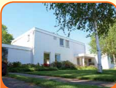
HEETEN, Holterweg 36

Onder architectuur gebouwde vrijstaande villa (inhoud 1.150 m 3 en woonoppervlak 320 m 2 ) met kantoor/praktijk/atelier (100 m 2 en kelder 25 m 2 ), bj. 1961, met garage, carport en 1.835 m 2 grond. Kenmerken villa: woon-eetkamer, extra werk-/tuinkamer, sauna, 4 slaapkamers, 2 badkamers en dakterras.