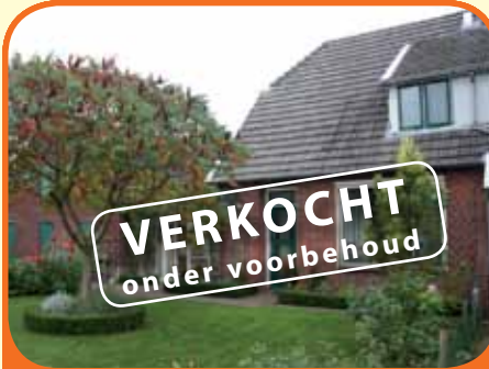
NIEUW HEETEN, Poggebeltweg 5

Helft van dubbel, bj. 1945 (in 1989 verbouwd), met 3.175 m 2 grond, grote schuur, garage en carport. Kenmerken: woonkeuken met inbouwapp., woonkamer, badkamer met douche, wastafelmeubel, toilet, urinoir, aansl. wasmachine en cv-opstelling (bj. 2009), serre (ca. 32 m 2 ), 3 slaapkamers en 2e toilet.