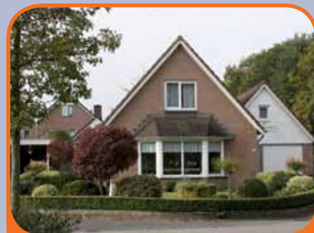
HEETEN, De Lange Slag 22

Vrijstaande semi-bungalow, bj. 1995, met garage en 598 m 2 grond. Kenmerken: royale zonnige woonkamer met serre, woonkeuken met inbouwapparatuur, slaapkamer en badkamer op begane grond, op verdieping 2 slaapkamers. Boven de garage bevindt zich een separaat toegankelijke verdieping.