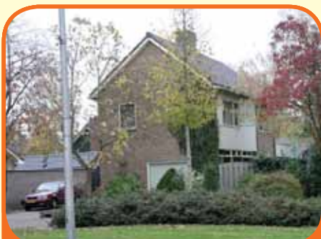
RAALTE, Zwolsestraat 42

Vrijstaand woonhuis, bj. 1963, met royale slaapkamer op begane grond en 560 m 2 grond. Kenmerken: tuingerichte L-kamer met openhaard en tuindeuren, dichte keuken, 5 slaapkamers (1 op begane grond), 2 badkamers, tuin met privacy, op loopafstand van centrum.