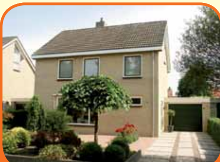
WIJHE, De Wandelingen 20

In 2005 geheel gerenoveerd royaal vrijstaand woonhuis, bj. 1975, met garage, houten tuinhuis en 410 m 2 grond. Fraaie tuin met veel privacy. Kenmerken: L-vormige woonkamer, luxe open keuken, bijkeuken, 4 ruime slaapkamers (extra kamers mogelijk), werkkamer, luxe badkamer, zoldervertrek.