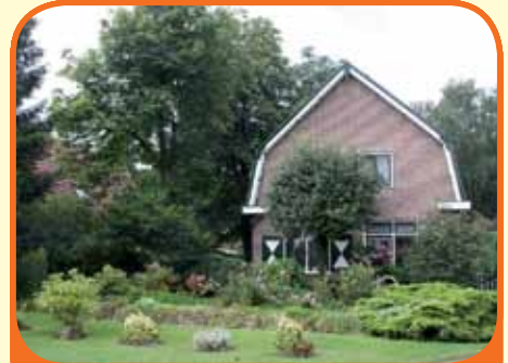
LUTTENBERG, Butzelaarstraat 46

Vrijstaand woonhuis, bj. 1937 (uitgebouwd in 1995), met garage (afm. 5.50 x 8.50 m) met smeerkelder en maar liefst 1.877 m 2 grond. De diepe landschapstuin met vijver en diverse terrassen grenst aan 'De Luttenberg'. Kenmerken: L-vormige woonkamer, tuinkamer, woonkeuken, badkamer en 3 slaapkamers.