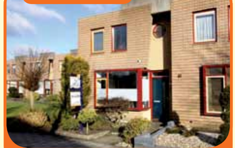
RAALTE, Fuut 12

Uitstekend onderhouden hoekwoning, bj. '94, met berging, carport/priël en 147 m 2 grond. Kenmerken: tuingerichte woonkamer met provisiekast en dubbele tuindeuren, moderne open woonkeuken met inbouwapparatuur, 3 slaapkamers en badkamer met ligbad, douchecabine, wastafelmeubel en 2 e toilet.