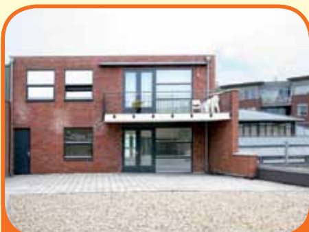
RAALTE, De Waag 37

In centrum gelegen nieuw gebouwd appartement op de 1e verdieping met dakterras (80 m 2 ), woonoppervlakte 115 m 2 (o.a. royale living, open woonkeuken met terrasdeuren en Frans balkon, 2 slaapkamers, volledig ingerichte badkamer), gezamenlijke fietsenberging, lift aanwezig.