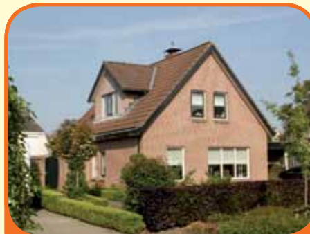
RAALTE, De Schouw 94

Vrijstaand woonhuis, bj. 1986, met carport, berging en 439 m 2 grond. Kenmerken: L-kamer met gashaard, aangrenzende eetkamer met openslaande tuindeuren, dichte keuken met inbouwapparatuur, kantoor (ca. 15 m 2 ), 3 royale slaapkamers (1 met loggia), luxe ingerichte badkamer met o.a. whirlpool bad.