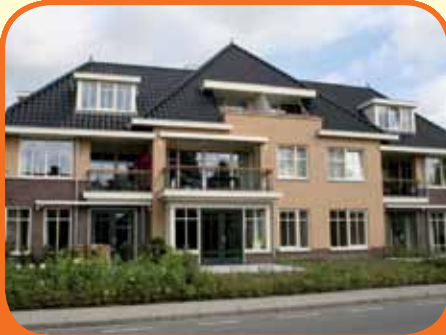
RAALTE, Vos de Waelhof 5

In het centrum gelegen nieuw gebouwd luxe en royale appartement (opp. ca. 135 m 2 ) op de begane grond met eigen terras, carport en berging. Kenmerken: royale woonkamer (ca. 65 m 2 ), open keuken, inpandige berging, badkamer, 2 slaapk., lift en videfooninstallatie. Collegiale verkoop met Bieze Makelaars.