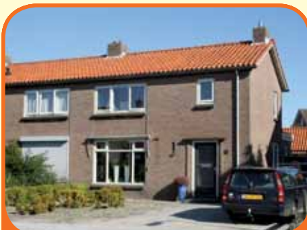
HEINO, De Haarstraat 24

Volledig gerenoveerde en gemoderniseerde uitgebouwde twee onder een kap woning, met geïsoleerde schuur (opp. circa 32 m 2 ) en 316 m 2 grond. Kenmerken: doorzonkamer, woonkeuken met inbouwapparatuur, bijkeuken, 3 slaapkamers, moderne badkamer, zolder. Woning is geheel af en direct bewoonbaar.