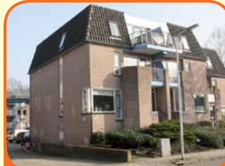
RAALTE, Jacob Reviusstraat 1a

Goed onderhouden driekamer appartement met berging en balkon. Vanuit de woning toegang tot de berging in de kelder. Kenmerken: woonkamer met open keuken (bj. 2005), badkamer met ligbad en vaste wastafel, 2 slaapkamers (ouderslaapkamer met toegang tot balkon). Servicek. € 75,80 p.mnd. Nabij centrum.