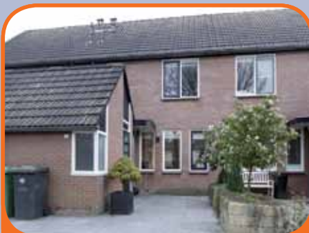
RAALTE, Wijnruit 14

In 2008 geheel gemoderniseerde tussenwoning, bj. 1979, met inpandige berging en 146 m 2 grond. Kenmerken: tuingerichte woonkamer met openhaard met schouw, open keuken (bj. 2008) met inbouwapparatuur, 4 slaapkamers, badkamer (bj. 2008) met douchecabine, wastafelmeubel (dubbel) en 2e toilet.