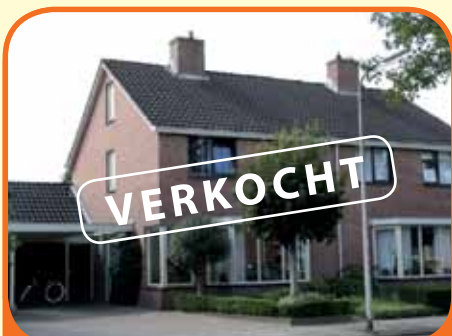
RAALTE, Het Erf 20

Helft van dubbel woonhuis, bj. 1981, met garage met zolderberging, carport, 2 bergingen, priel en 394 m 2 grond. Kenmerken: L-kamer met serre en moderne schouw met gasinzethaard, open keuken met inbouwapparatuur, 3 slaapkamers, badkamer met ligbad, douche, 2e toilet en dubbele wastafel, zolderberging.