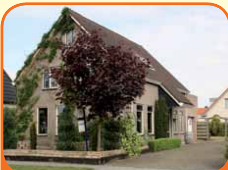
HEINO, Marktstraat 39

Geheel onderkelderd vrijstaand woonhuis met slaap- en badkamer op de begane grond, bj. 1984, met garage, tuinhuis en 667 m 2 grond. Kenmerken: kelder (120 m 2 ), woonkeuken, woonkamer, bijkeuken, 2 badkamers, 7 slaapkamers, in het centrum gelegen, aan voorzijde vrij uitzicht.