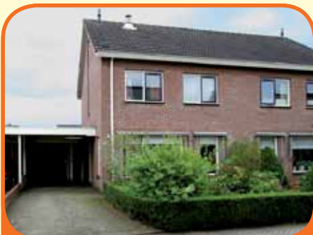
RAALTE, Wulp 14

Helft van dubbel woonhuis, bj. 1986, met garage, carport en 293 m 2 grond. Kenmerken: L-kamer met massief houten vloer, houthaard met natuurstenen schouw en openslaande tuindeuren, open keuken met inbouwapp., 4 slaapkamers en volledig ingerichte badkamer. Bijzonder vrije ligging aan achterzijde.