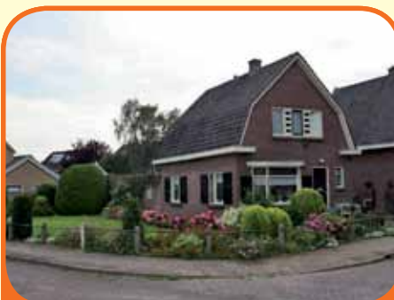
WIJHE, Kerkpadsblok 16

Goed onderhouden karakteristiek vrijstaand woonhuis, bj. 1938 met vrijstaande dubbele garage (afm. 5.25 x 7 m), stenen schuren en 847 m 2 grond. De woning bezit nog authentieke elementen. Kenmerken: kamer en suite met erker, originele schouwen en schuifdeuren, keuken, kelder, 3 slaapkamers.