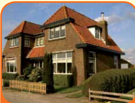
OLST, Rijksstraatweg 22

Zeer karakteristiek helft van dubbel woonhuis, bj. 1933, met vrijstaande garage en 370 m 2 grond. Kenmerken: doorzonkamer, dichte keuken, ruime bijkeuken, kelder, 3 slaapkamers, badkamer op de verdieping, recent buitenzijde geschilderd.