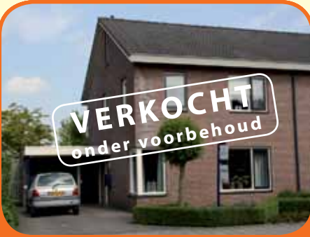
HEETEN, Stellingmolen 8

Royaal helft van een dubbel woonhuis, bj. 1995, met garage, carport en 297 m 2 grond. Kenmerken: royale woonkamer met ruime zit-hoek en eetgedeelte, open keuken met inbouwapparatuur, 3 slaapkamers, royale badkamer met ligbad, douche, vaste wastafel en 2e toilet, zolder. Vrij uitzicht.