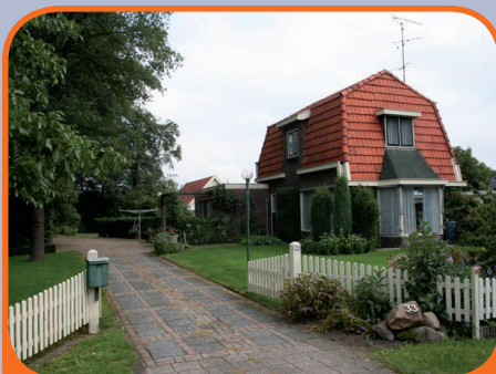
HEINO, Lemelerveldseweg 33

Vrijstaand woonhuis, bj. ca. 1935 (belangrijk vergroot en verbouwd in 1973), met fraaie hobbyschuur/atelier, garage, carport en 3.270 m 2 grond. Riante tuin met wandelbos. Kenmerken: woonkamer, woonkeuken, slaap- en badkamer op beg. grond, 2 slaapkamers op verdieping. Net buiten Heino (2 km) gelegen.