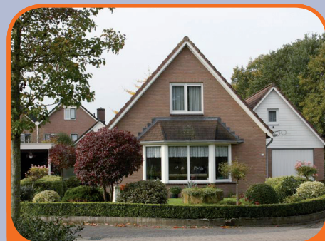
HEETEN, De Lange Slag 22

Vrijstaande semi-bungalow, bj. 1995, met garage en 598 m 2 grond. Kenmerken: royale zonnige woonkamer met serre, woonkeuken met inbouwapparatuur, slaapkamer en badkamer op begane grond, op verdieping 2 slaapkamers. Boven de garage bevindt zich een separaat toegankelijke verdieping.