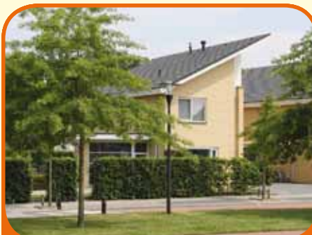
RAALTE, Twickel 17

Modern en uitstekend onderhouden royaal uitgebouwd geschakeld vrijstaand woonhuis (770 m 3 ) met vrij uitzicht gelegen, bj. 2001, met garage, carport en 458 m 2 grond. Kenmerken: royale L-kamer met schuifpui, luxe woonkeuken, eet-/speelkamer, 3 slaapkamers, luxe badkamer, werkruimte en zolderberging.