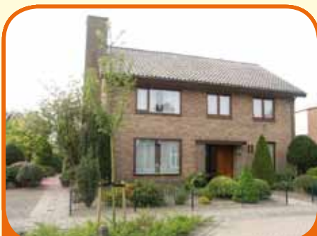
OLST, Boskamp 38

Zeer royaal vrijstaand woonhuis (645 m 3 ), bj. 1974, met grote garage (ca. 40 m 2 ) en een zeer vrije kavel van 940 m 2 grenzend aan de weilanden! Verzorgde tuin met blokhut (12m 2 ). Kenmerken o.a.: royale living, dichte keuken, kelder, bijkeuken, 6 slaapkamers, royale zolder.