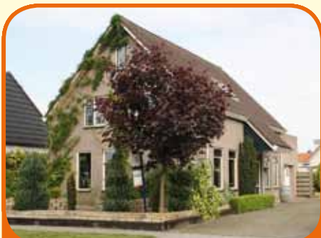
HEINO, Marktstraat 39

Geheel onderkelderd vrijstaand woonhuis met slaap- en badkamer op de begane grond, bj. 1984, met garage, tuinhuis en 667 m 2 grond. Kenmerken: kelder (120 m 2 ), woonkeuken, woonkamer, bijkeuken, 2 badkamers, 7 slaapkamers, in het centrum gelegen, aan voorzijde vrij uitzicht.