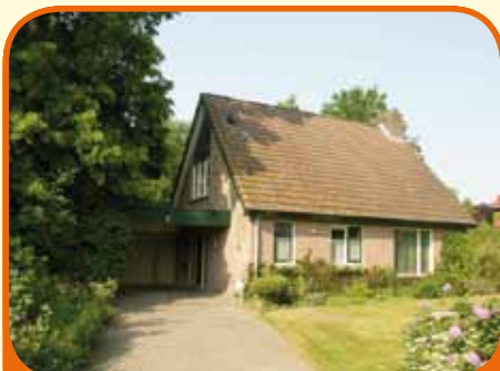
WIJHE, De Grienden 8

Nabij het centrum gelegen vrijstaande semi-bungalow, bj. 1990, met aangebouwde ruime stenen garage, carport en 952 m 2 grond. Kenmerken: hal met vide, woonkamer, open keuken, bijkeuken, royale slaapkamer en complete badkamer begane grond, 2 slaapkamers en badkamer verdieping, zolder.