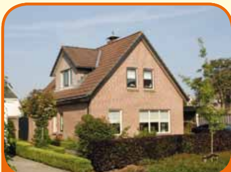
RAALTE, De Schouw 94

Vrijstaand woonhuis, bj. 1986, met carport, berging en 439 m 2 grond. Kenmerken: L-kamer met gashaard, aangrenzende eetkamer met openslaande tuindeuren, dichte keuken met inbouwapparatuur, kantoor (ca. 15 m 2 ), 3 royale slaapkamers (1 met loggia), luxe ingerichte badkamer met o.a. whirlpool bad.