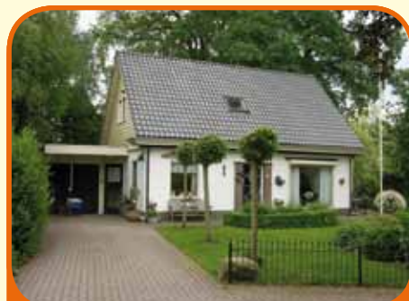
WIJHE, Wijhendaalseweg 4/c

Op één van de mooiste locaties van Wijhe gelegen charmant vrijstaand woonhuis, bj. 1955/2000, met garage en ca. 635 m 2 grond. De woning is in 2000 nagenoeg volledig nieuw gebouwd en voorzien van alle comfort. Geschikt voor verschillende doelgroepen. Slaap- en badkamer begane grond.