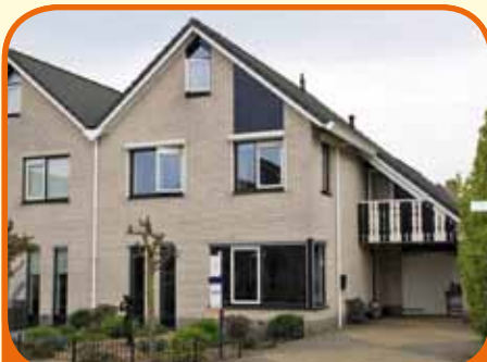
LEMELERVELD, Ds. C. Keerstraat 51

Helft van dubbel woonhuis, bj. 2000, met garage, carport en 315 m 2 grond. Tuin op het oosten. Kenmerken: L-kamer met plavuizen- vloer, open woonkeuken met inbouwappara- tuur, 4 slaapkamers en badkamer met ligbad, douchecabine, dubbele wastafel en 2e toilet, grote zolder met vele mogelijkheden.