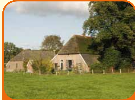
OLST, Spijkerbospad 5

Op Landgoed Spijkerbosch naast Huis 'Spijkerbosch' gelegen karakteristieke vrijstaande boerderij met aangebouwde schuur, kapschuur en ca. 10.000 m 2 eigen grond (géén erfpacht) . Kenmerken: gewelvenkelder, woonkamer met schouw, originele tegelwand en bedsteden, achterhuis (ca. 200 m 2 ).