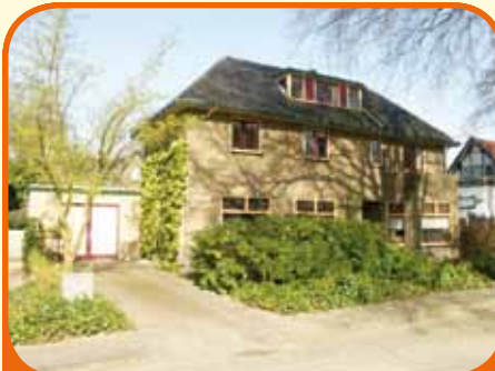
WIJHE, Stationsweg 50

Karakteristieke vrijstaande dorpsvilla, bj. 1933, met royale garage, veranda en 380 m 2 grond. Gelegen op loopafstand van station en centrum. Kenmerken: souterrain (75 m 2 ), fraaie hal met bordestrap, woonkamer (40 m 2 ), luxe open keuken, bijkeuken, werkkamer, 4 slaapkamers verdieping, ruime zolder.