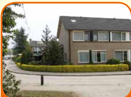
RAALTE, van der Wijkstraat 29

Uitgebouwd helft van dubbel woonhuis, bj. 1971, met vrijstaande garage en 318 m 2 grond. Tuin met veranda en buitenberging gelegen op het oosten. Kenmerken: L-vormige woonkamer, gesloten keuken, aangeb. bijkeuken met toilet, 4 slaapkamers, badkamer met douche, vaste wastafel en 2e toilet, nabij centrum.