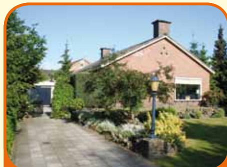
HEINO, Woolthuisweg 24

Semi-bungalow, bj. 1965, met garage (30 m 2 ) en 1.092 m 2 grond. Kenmerken: woonkamer met schouw en terrasdeur, keuken met inbouwapparatuur, kelder, 3 slaapkamers, badkamer met ligbad, douchecabine en vaste wastafel, grote bergzolder. Bouwvergunning aanwezig voor een garage/carport van 100 m 2 .