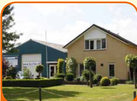
RAALTE, Wechelerweg 22

Moderne bedrijfswoning met vrij uitzicht en een in pandig bereikbare vrijstaande hal (240 m 2 ), bj. 1997, gelegen op 1.068 m 2 grond. Kenmerken: woonkamer (ca. 36 m 2 ), moderne keuken met inbouwapparatuur, serre, werkkamer, 4 slaapk. en badkamer. Hal met showroom en voldoende parkeerplaatsen.