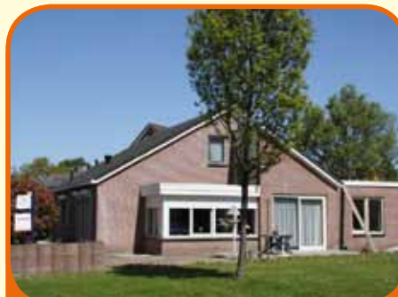
RAALTE, Torenvalk 38

Fraai en royaal vrijstaand woonhuis met vrij uitzicht, bj. '93, met carport/berging en 470 m 2 grond. Kenmerken: woonkamer voorzien van marmerenvloer met vloerverwarming, werk- kamer, royale luxe woonkeuken, bijkeuken, slaapkamer en badkamer begane grond, 1 slaapkamer met bergruimte op verdieping.