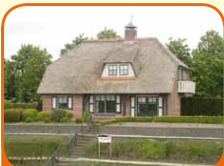
WIJHE, De Brabantse Wagen 2

Op toplocatie met zicht op de IJssel gelegen vrijstaand landhuis, bj. 1981 met 1.636 m 2 grond. De woning is geheel onderkelderd met inpandige garage voor 2 auto's. Kenmerken o.a.: ruime living, dichte keuken, slaap-/werk-kamer b.g., 4 ruime slaapkamers met balkon op verdieping.