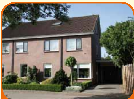
RAALTE, Koolmees 19

Helft van dubbel woonhuis, bj. 1987, met garage, carport en 271 m 2 grond. Kenmerken: royale woonkamer met schuifpui, halfopen uitgebouwde keuken met inbouwapparatuur (2001), bijkeuken, 5 slaapkamers, luxe badkamer met douche, toilet en wastafelmeubel (2007), gelegen op fraaie plek met vrij uitzicht.