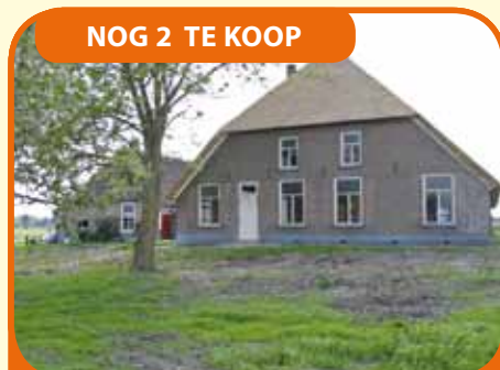
NOG 2 TE KOOP