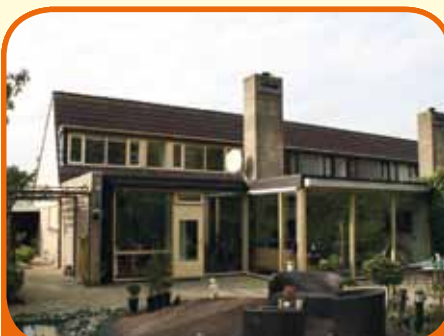
RAALTE, Populierenplein 2

Geschakelde hoekbungalow, bj. 1973, met garage, berging, 606 m 2 grond. Fraaie, besloten patio. Kenmerken: tuinkamer (60 m 2 ) met inzethaard, open keuken met inb.app., bijkeuken, slaap- en badkamer op begane grond, 3 slaapkamers en badkamer op verdieping. Rustig gelegen op korte afstand van centrum.