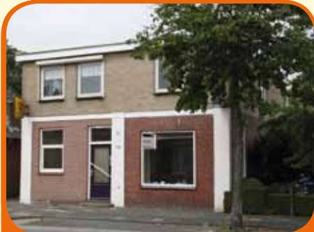
HEINO, Dorpsstraat 79

Vrijstaand woon-/winkelpand, bj. 1930, verbouwd in 1966, met garage, schuur en 360 m 2 grond. Kenmerken: woonk./winkel (23 m 2 ), badk. met douche, toilet en wastafelmeubel, woonkamer (15 m 2 ), woonkeuken met inbouwapparatuur, bijkeuken, douche, 4 slaapkamers, in het centrum gelegen.