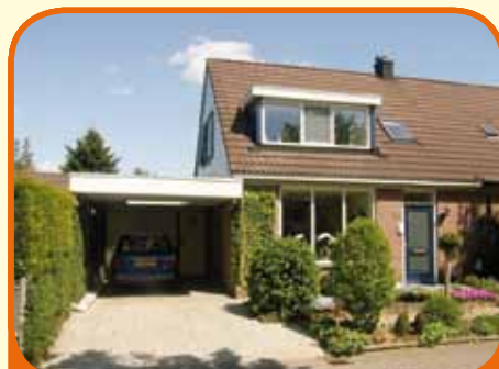
LIERDERHOLTHUIS, Kerkslagen 23

Moderne en lichte helft van een dubbele woning met slaap- en badkamer op begane grond, bj. 1986, met garage, carport, tuinhuis en 276 m 2 grond. Tuin op het oosten. De woning is in 2002 nagenoeg geheel gerenoveerd. Verdieping 2 royale slaapkamers met dakkapellen en badkamer.