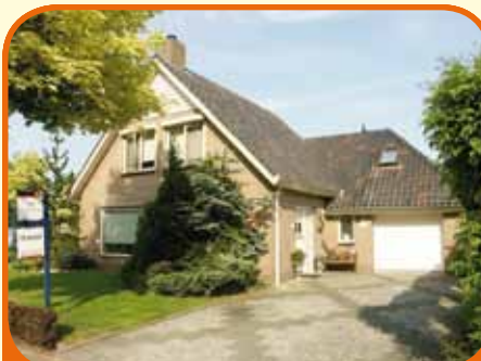
BROEKLAND, Rabbershoek 31

In het dorpshart gelegen verzorgde vrijstaande woning, bj. 1976, met inpandige garage, tuinhuis, veranda en 491 m 2 grond. De ruime achtertuin op het westen biedt veel privacy. Kenmerken: L-woonkamer, luxe woonkeuken, bijkeuken, 3 slaapkamers, badkamer, bergzolder.