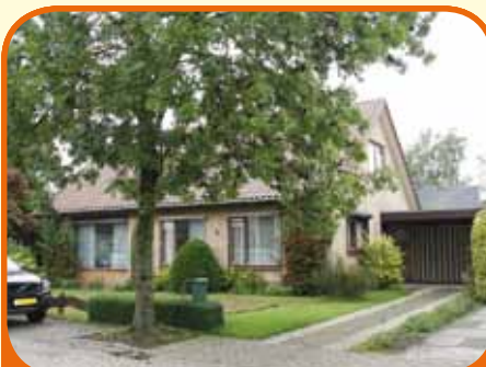
RAALTE, Halewecstraat 4

Vrijstaand woonhuis, bj. 1972, met garage/berging (ca. 35 m 2 ) en 626 m 2 grond. Kenmerken: L-kamer met gashaard en schuifpui naar het terras, gesloten keuken met eenvoudige inrichting, badkamer met douche en vaste wastafel, bijkeuken, op verdieping 2 e toilet en 3 slaapkamers. Centrum op loopafstand.