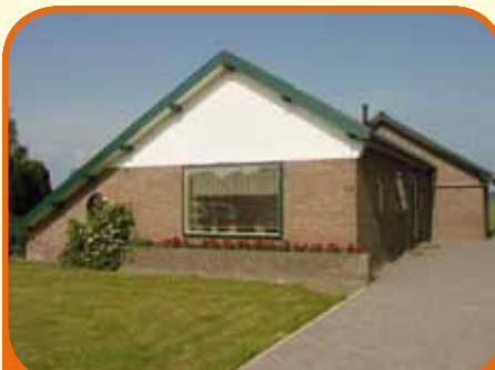
OLST, Rijkstraatweg 99

Nabij de uiterwaarden van de IJssel gelegen vrijstaande bungalow met ca. 12.200 m 2 grond. Het perceel grenst direct aan een schitterende kolk met privé-strandje. Bijbouwen bijgebouw tot 140 m 2 toegestaan. Kenmerken: ruime woonkamer, keuken, bijkeuken, 3 slaapkamers, badkamer, grote zolder.