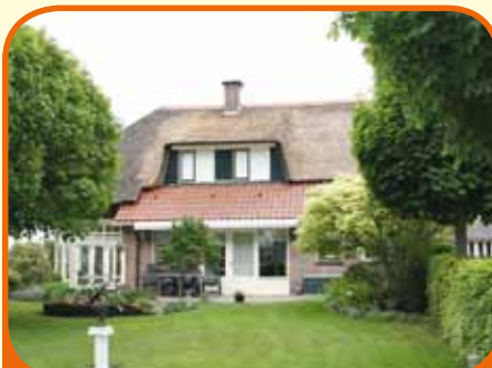
WIJHE, Engeweg 1

Riet gedekt landhuis, bj. 1990 en vergroot in '04, met riante serre (ca. 26 m 2 ), schuur met paardenboxen, royale garage/werkplaats en 4.775 m 2 grond. Kenmerken: woonkamer, open keuken (bj. '07) met inbouwapp., slaap- en badkamer op beg. grond, 3 slaapkamers op verd. Wijhe 6,5 km en Raalte 5,5 km.