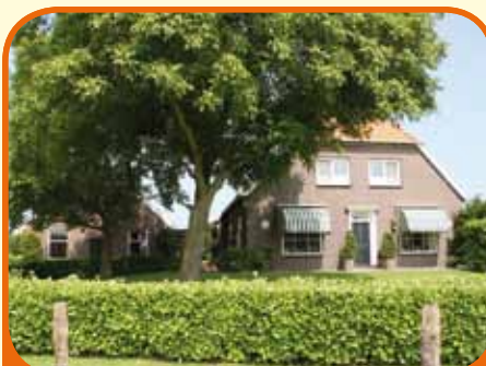
WIJHE, Het Anem 2/F

Karakteristieke woonboerderij, in 1948 herbouwd, met zwembad, functioneel bijgebouw (afm. circa 15.10 x 10 m), tuin en weiland. Totale perceeloppervlakte circa 15.000 m 2 . Bijgebouw voor meerdere doeleinden in te richten. Vrij gelegen echter met alle voorzieningen van het dorp op korte afstand.