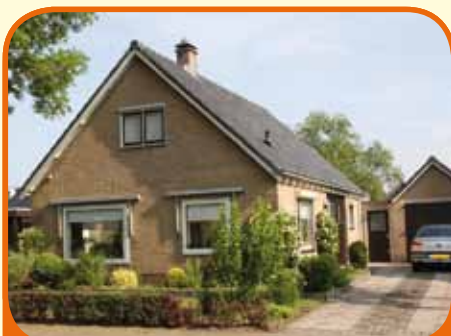
RAALTE, Spinhuisstraat 38

Nabij het centrum gelegen semi-bungalow, bj. 1966, met vrijstaande garage/berging (ca. 21 m 2 ) en 550 m 2 grond. Centrumvoorzieningen op loopafstand. Kenmerken: woonkamer met open haard, woonkeuken (2005), slaap- en badkamer (2005) begane grond, 3 slaapkamers verdieping, zolderberging.