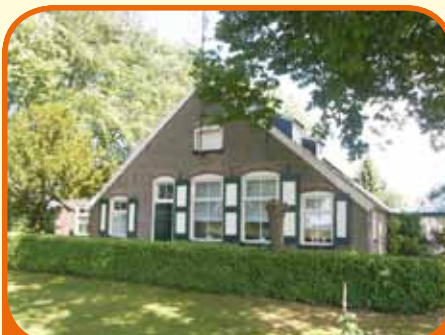
WIJHE, Elshofweg 4

In het buitengebied van Wijhe in de buurtschap Elshof gelegen halfvrijstaande woonboerderij bj. 1915 met circa 10.000 m 2 grond. Kenmerken: woonkamer, dichte keuken, 5 slaapkamers, berging. Het onderhoud van de woning is belangrijk achterstallig. Gedeeltelijk renovatie is nodig.