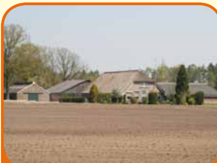
WESEPE, Velsdijk 4

Fraai gelegen goed onderhouden woonboerderij, bj. 1933, met schuren, buitenbak en 15.005 m 2 grond. De woonboerderij is geschikt voor particuliere bewoning. Boerderijsplitsing, deelname aan Rood voor rood regeling en/of VAB-regeling e.d. behoren tot de nader uit te werken mogelijkheden.