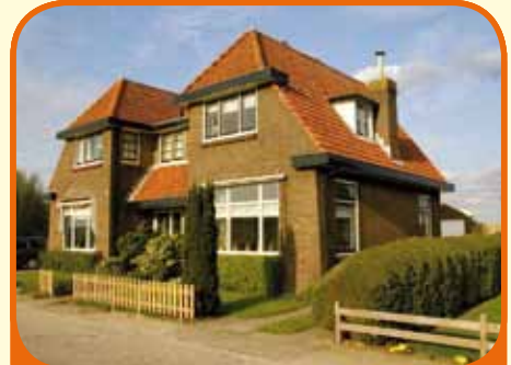
OLST, Rijksstraatweg 22

Zeer karakteristiek helft van dubbel woonhuis, bj. 1933, met vrijstaande garage en 370 m 2 grond. Kenmerken: doorzonkamer, dichte keuken, ruime bijkeuken, kelder, 3 slaapkamers, badkamer op de verdieping, recent buitenzijde geschilderd.