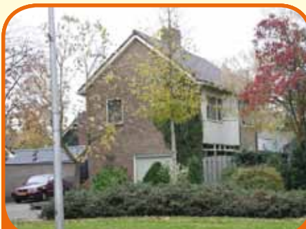
RAALTE, Zwolsestraat 42

Vrijstaand woonhuis, bj. 1963, met royale slaapkamer op begane grond en 560 m 2 grond. Kenmerken: tuingerichte L-kamer met openhaard en tuindeuren, dichte keuken, 5 slaapkamers (1 op begane grond), 2 badkamers, tuin met privacy, op loopafstand van centrum.