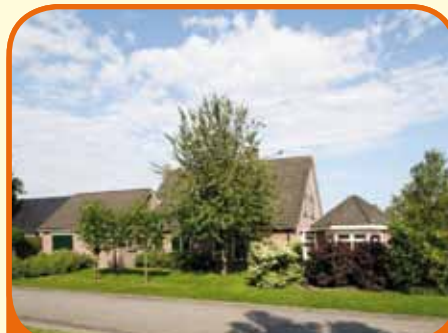
RAALTE, Putter 2

Vrijstaand woonhuis, bj. 1989, met garage, berging/priël en 968 m 2 grond. Kenmerken: werkkamer, luxe open keuken, bijkeuken, royale L-kamer, royale serre, 4 slaapkamers, badkamer met bad, douchecabine, toilet en vaste wastafel. Op fraaie locatie aan een rustige weg, gehuld in veel grond gelegen.