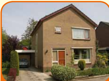
WIJHE, Wilheminalaan 3

Goed onderhouden vrijstaande woning, bj. 1973, met vrijstaande garage, carport en 417 m 2 grond. De tuin is zeer verzorgd aangelegd, met overkapping en fruitbomen. Op loop- afstand van centrum, station en basisschool gelegen. Kenmerken: Z-kamer, dichte keuken, bijkeuken, 3 slaapkamers, badkamer.