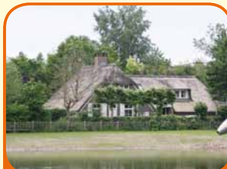
HEINO, Paalweg 19

Vrijstaand rietgedekt landhuis, bj. 1984, met garage, carport, houten schuur en 1.522 m 2 grond. Kenmerken: kelder, zonnige woonka- mer, royale woonkeuken (bj. '03) met inbou- wapparatuur, slaapkamer en badkamer op begane grond, 4 slaapk. en 2e badkamer op verdieping, aan water en nabij centrum Heino.