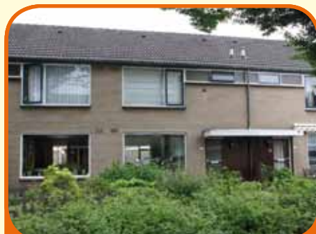
RAALTE, Beukensingel 116

Tussenwoning, bj. 1973, met berging en 168 m 2 grond. Tuin op het westen. Kenmerken: doorzonkamer, gesloten keuken met toegang tot de tuin, 4 royale slaapkamers (1 met groot dakvenster) en badkamer met douche, vaste wastafel, 2e toilet en aansluiting voor wasmachine/droger, nabij centrum gelegen.