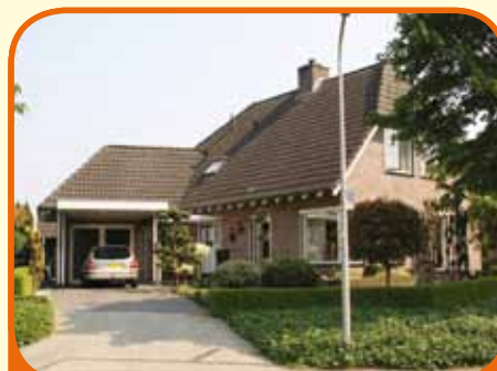
HEETEN, Nienhof 92

Royaal vrijstaand woonhuis, bj. 1992, met garage/berging (met zolderberging), carport en 535 m 2 grond. Kenmerken: L-kamer met eikenhoutenvloer, erker en schouw met houtkachel, woonkeuken met inbouwapp. en schuifpui, 3 slaapkamers, badk. met douche-cabine, wastafelmeubel en 2 e toilet, hobbyk..