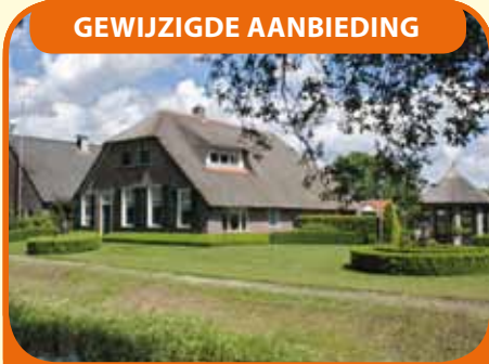
WIJHE, Hagenvoorde 1

Tussen Wijhe, Heino en Raalte gelegen woonboerderij, bj. 1890, met tuinhuis, bijgebouwen en ca. 7.000 m 2 grond. Aankoop meer grond bespreekbaar. Dubbele bewoning hoofdgebouw mogelijk. Daarnaast is het mogelijk om o.b.v. Rood-voor-Rood gebouwen te slopen en hiervoor een woning terug te bouwen.