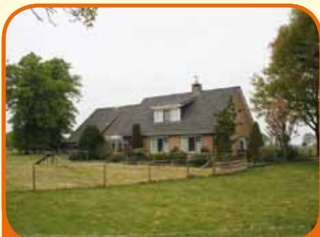
HAARLE, Poggenbeltweg 10

Vrijstaand woonhuis met bijbehorende schuren op ca. 0.50.00 ha grond. Meer grond bij te koop tot 6.96.00 ha. Kenmerken: woonkamer met eiken parketvloer, woonkeuken met inbouwapparatuur, bijkeuken, kelder, serre, badkamer met douche, toilet en wastafelmeubel, 4 slaapk. (1 op begane grond), vrij gelegen.