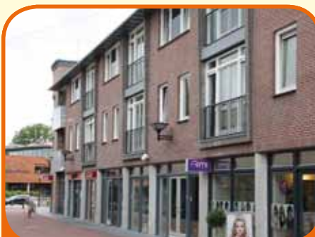
RAALTE, Nieuwe Markt 23

Fraai appartement, bj. 2009, in het centrum gelegen op de 2e verdieping. Kenmerken: woonkamer met frans balkon, luxe open keuken met inbouwapp., badkamer met douchecabine, wastafelmeubel met 2 wastafels, 2 slaapkamers, geheel v.v. laminaatvloer, gezamenlijke fietsenberging. Servicekosten € 56,- p/m.