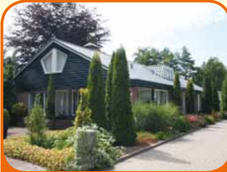
RAALTE, Nieuwe Lemelerveldseweg 11

Vrijstaand woonhuis, bj. 1983, met garage, multifunctioneel atelier (140 m 2 ), wagenloods (72 m 2 ), fraai aangelegde wandeltuin en 7.425 m 2 grond. Kenmerken: woonkamer, woonkeuken, slaapkamer en badkamer op begane grond, 3 slaapkamers op verdieping. Afstand tot Raalte-dorp slechts 5 km.