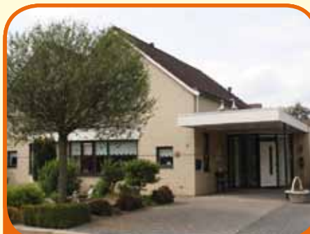
RAALTE, Tulpenstraat 2c

Helft van dubbel woonhuis met slaap- en badkamer op de begane grond, bj. 1996, met berging, carport en 266 m 2 grond. Kenmerken: woonkamer met gashaard en schuifpui, open keuken met inbouwapparatuur, op verdieping 2 slaapkamers en berging. Centrumvoorzieningen en NS-station op loopafstand.