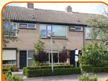
HEETEN, Vredeveldstraat 10

Moderne tussenwoning, bj. 1974, met aangebouwde berging/bijkeuken en 147 m 2 grond. Fraai aangelegde tuin met achterom. Kenmerken: doorzonkamer (30 m 2 ) met eiken houten vloer, dichte keuken met inbouwapparatuur, 4 slaapkamers, badkamer met douche en wastafelmeubel en op verdieping separaat 2e toilet.