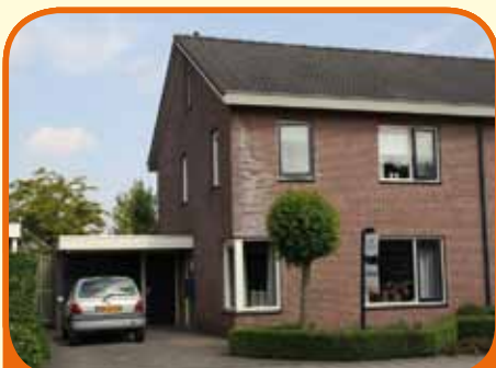
HEETEN, Stellingmolen 8

Royaal helft van een dubbel woonhuis, bj. 1995, met garage, carport en 297 m 2 grond. Kenmerken: royale woonkamer met ruime zithoek en eetgedeelte, open keuken met inbouwapparatuur, 3 slaapkamers, royale badkamer met ligbad, douche, vaste wastafel en 2 e toilet, zolder. Vrij uitzicht.