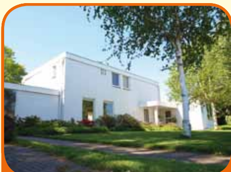
HEETEN, Holterweg 36

Onder architectuur gebouwde vrijstaande villa (inhoud 1.150 m 3 en woonoppervlak 320 m 3 ) met kantoor/praktijk/atelier (100 m 2 en kelder 25 m 2 ), bj. 1961, met garage, carport en 1.835 m 2 grond. Kenmerken villa: woon- en eetkamer, extra werk-/tuinkamer, sauna, 4 slaapkamers, 2 badkamers en dakterras.