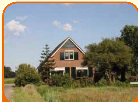
RAALTE, Kanaaldijk O.Z. 27

Gelegen op fraaie locatie in buitengebied nabij Raalte-zuid en landgoed Schoonheten, goed onderhouden, vrijstaande woning, bj. 1974, met garage en ca. 4.000 m 2 grond.