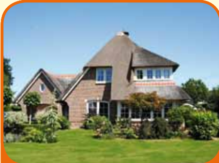
RAALTE, Raarhoeksweg 8

Onder architectuur gebouwde riante rietgedekte villa (975 m 3 ), bj. 2002, met garage/berging en 854 m 2 grond. Kenmerken: kelder, royale zonnige living, woonkeuken met inbouwapp., slaap- en badkamer op beg. grond, op verd. o.a. 5 slaapkamers en 2e badkamer, op 2e verd. twee royale zolderbergingen.