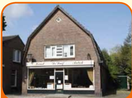
HEINO, Dorpsstraat 91

In het centrum gelegen woon-/winkelpand, bj. 1930 verbouwd in 1960 met vrijstaande schuur/werkruimte (opp. ca. 120 m 2 ) met zolderverdieping en souterrain (ca. 48 m 2 ) en 472 m 2 grond. Winkelruimte ca. 95 m 2 , frontbreedte 7 meter. Bovenwoning v.v. eigen opgang en voorzieningen.