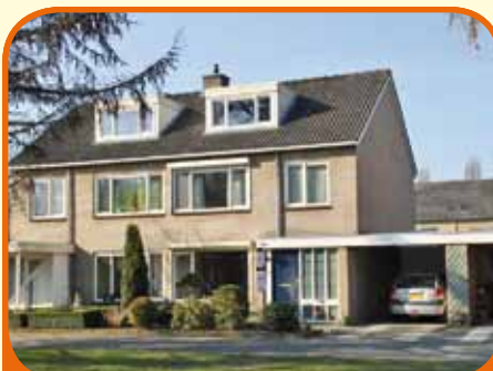
RAALTE, Larixplein 11

Helft van dubbel woonhuis, bj. 1973, met garage, carport en 241 m 2 grond. Fraaie tuin met veranda. Kenmerken: Z-kamer met eiken parket, gesloten keuken met inbouwapparatuur, 3 slaapkamers (1 met balkon), badkamer met douche, vaste wastafel en toilet, royale hobby-/slaapkamer, rustig aan plein gelegen.