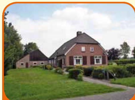
HEINO, Molenweg 4a

Woonboerderij, bj. 1954-55 en gedeeltelijk verbouwd in 1995, met wagenloods, kapschuur en ca. 3.200 m 2 grond. Kenmerken: slaap- en badkamer op beg. grond, woonkamer en-suite met eenvoudige open keuken, bijkeuken, deel (ca. 80 m 2 ), op verd. douche-ruimte, toilet, 3 slaapk. en grote zolderberging.