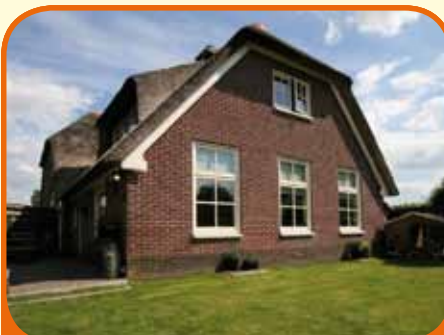
Heeten, Vlessendijk 14

Helft van een rietgedekte woonboerderij, bj. ca. 1977 en in 2005 geheel gemoderniseerd met 243 m 2 grond. Kenmerken: kelder, badkamer (bj. 2009) met bad, separate douche en vaste wastafel, tuingerichte woonkamer, open woonkeuken met inbouwapparatuur, bijkeuken, 3 slaapkamers en zolderberging.