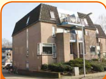
RAALTE, Jacob Reviusstraat 1a

Goed onderhouden driekamer appartement met berging en balkon. Vanuit de woning toe- gang tot de berging in de kelder. Kenmerken: woonkamer met open keuken (bj. 2005), bad- kamer met ligbad en vaste wastafel, 2 slaapkam- ers (ouderslaapkamer met toegang tot bal- kon). Servicek. € 75,80 p.mnd. Nabij centrum.