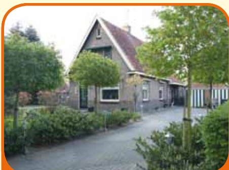
WESEPE, Weth. M. van Doorninckweg 24

Fraai aan de rand van 120 hectare bos gelegen vrijstaand woonhuis, bj. 1935, met garage, fraaie veranda (20 m 2 ) en circa 550 m 2 grond. Nagenoeg geheel gemoderniseerd in 2005. Kenmerken: woonkamer, royale woonkeuken met inbouwapparatuur, bijkeuken, 4 slaapkamers, badkamer, zolderberging.