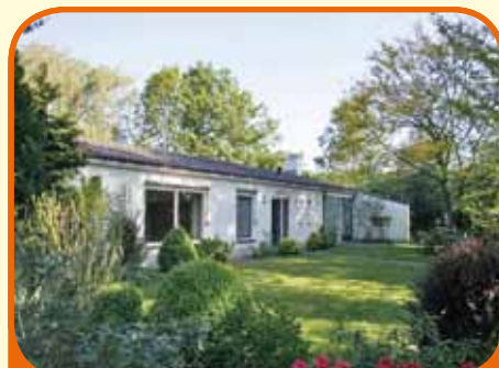
HEINO, Stationsweg 18

Nabij het centrum van Heino (> 500 m) schitterend vrij gelegen semi-bungalow, bj. 1965, met garage, carport, schuur en 1.820 m 2 grond. Fraai aangelegde tuin met meerdere terrassen rondom. Kenmerken: L-kamer met openhaard, terrasdeuren en schuifpui, woonkeuken, 4 slaapkamers en 2 badkamers.