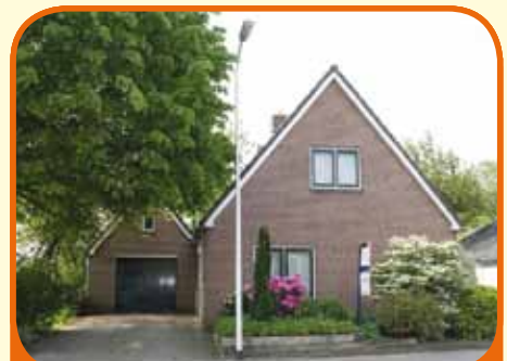
LIERDERHOLTHUIS, Herenbrinksweg 5a

Vrijstaand woonhuis, bj. 1980, met garage (v.v. zolder) en 310 m 2 grond. Vrij en weids uitzicht over de groene landerijen rondom. Kenmerken: woonkamer met openhaard, extra slaap- en badkamer op begane grond, keuken, bijkeuken, 2 slaapkamers en 2e badkamer op verdieping, aan rand van dorp gelegen.