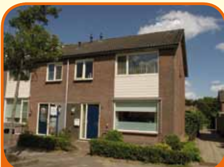
WIJHE, Dijkzicht 23

Nabij IJssel gelegen hoekwoning, bj. 1970, met stenen berging en 210 m 2 grond. Kenmerken: doorzonkamer, halfopen keuken met apparatuur, bijkeuken, 4 slaapkamers, badkamer met o.a. ligbad, ruime zolderberging, HR combi-ketel (2005). Gedeeltelijk kunststof kozijnen met dubbel glas.