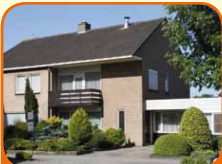
RAALTE, Westdorplan 18

Geschakelde twee-onder-een-kap-woning, bj. 1971 en 338 m 2 grond. Kenmerken: keuken (bj. 2001) met inbouwapparatuur, doorzonkamer, royale werk/hobbykamer (ca. 24 m 2 en slaapkamer mogelijk), 3 slaapkamers (1 met balkon), badkamer (bj. 1971), zeer royale zolderberging (extra slaapkamers mogelijk).