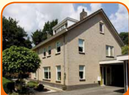
RAALTE, Houtduif 6

Royaal helft van dubbel woonhuis, bj. 1996, met garage, carport en 284 m 2 grond. Kenmerken: L-kamer met natuurstenen vloer, schouw en schuifpui, woonkeuken met inbouwapp. (bj. 2003), hobby/speelkamer, 5 slaapkamers en royale badkamer (bj. 2002) met ligbad, douchehoek, wastafelmeubel en 2 e toilet.