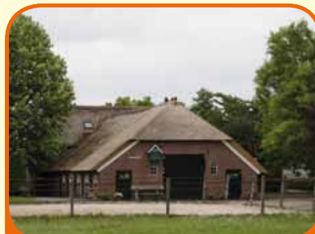
HEETEN, Weeleweg 16

Woonboerderij, bj. 1930, verbouwd in 1990, met paardenstal met 4 grote boxen, buitenrijbak en 9.064 m 2 grond. Kenmerken: woonkamer met gashaard, open keuken, badkamer met bad, douche, vaste wastafel en toilet en slaapkamer op begane grond, hobbyruimte (ca. 100 m 2 ), 3 slaapkamers op verdieping.