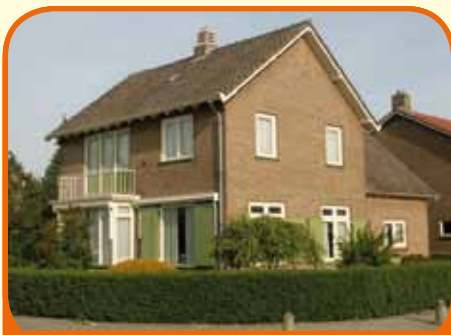
OLST, Ds. K. Terpstrastraat 17

Fraai op loopafstand van het centrum en NS-station gelegen karakteristiek vrijstaand woonhuis, bj. 1957, met garage en 444 m 2 grond. De tuin is rondom gelegen, zeer vrij uitzicht door ligging op hoek. Kenmerken: royale hal/entree, kelder, woonkamer (40 m 2 ) met open haard, 3 slaapkamers.