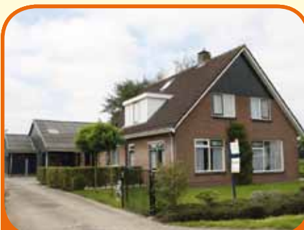
LAAG ZUTHEM, Hagenweg 19

Zeer landelijk gelegen royaal vrijstaand woonhuis (720 m 3 ), bj. 1970, in 1998 in zijn geheel verbouwd, met 9.050 m 2 grond. Paardenstal ingericht met 5 boxen, een zadelkamer, werkplaats en hooiopslag, kapschuur en rijbak, afm. 20 x 40 meter, met lichtmasten. Kenmerken: 4 slaapkamers, luxe woonkeuken, bijkeuken.