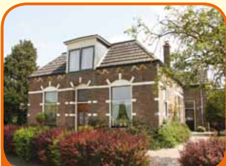
HEINO, Stationsweg 9c/11

Op unieke locatie aan de rand van het dorp en toch nabij centrum, schitterend vrij gelegen herenhuis, bj. 1910, met vrijstaande garage (5x6 meter), schuur (7x5 meter) en 1.792 m 2 grond. De naastgelegen kavel behoort tot het object waardoor de tuin schitterend rondom en op het zuidoosten is georiënteerd.