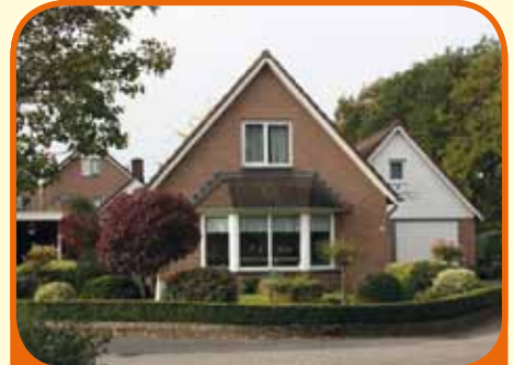
HEETEN, De Lange Slag 22

Vrijstaande semi-bungalow, bj. 1995, met garage en 598 m 2 grond. Kenmerken: royale zonnige woonkamer met serre, woonkeuken met inbouwapparatuur, slaapkamer en badkamer op begane grond, op verdieping 2 slaapkamers. Boven de garage bevindt zich een separaat toegankelijke verdieping.