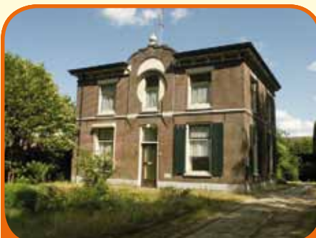
WIJHE, Boerhaar 13

Landelijk, aan de rand van het dorp Boerhaar gelegen klassiek vrijstaand woonhuis, bj. 1889 met schuur en 1.200 m 2 grond. Aan de Soestwetering gelegen met vrij uitzicht aan de voorzijde. Kenmerken: kamer en-suite, studeerkamer, woonkeuken, kelder, 5 ruime slaapkamers en doucheruimte.