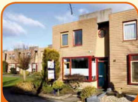
RAALTE, Fuut 12

Uitstekend onderhouden hoekwoning, bj. '94, met berging, carport/prieeel en 147 m 2 grond. Kenmerken: tuingerichte woonkamer met provisiekast en dubbele tuindeuren, moderne open woonkeuken met inbouwapparatuur, 3 slaapkamers en badkamer met ligbad, douchecabine, wastafelmeubel en 2 e toilet.