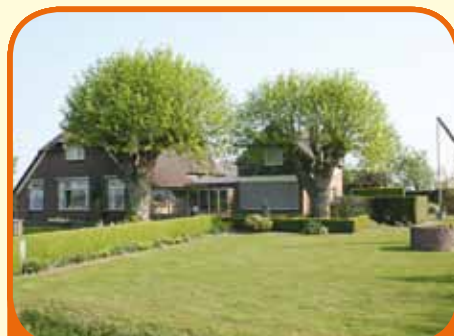
NIEUW HEETEN, Portlanderdijk 30

Fraai nabij Nieuw Heeten gelegen Sallandse woonboerderij, bj. 1925, met aangebouwd gastenverblijf, schuur (ca. 120 m 2 ) en ca. 6.625 m 2 grond. Kenmerken: 2 woonkamers, 2 keukens, 6 slaapkamers, 2 badkamers en hobbyruimte. Het object is uitermate geschikt voor het (hobbymatig) houden van kleinvee.