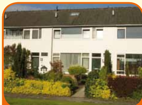
WIJHE, Noorder Koeslag 54

Aan groenstrook gelegen royale tussenwoning, bj. 1972, met vrijstaande bergingen en 194 m 2 grond. Voldoende parkeermogelijkheden aan de voorzijde. Royale voor- en achtertuin. Kenmerken: ruime doorzonkamer, luxe keuken, 4 slaapkamers, dakkapel, nieuwe kunststofgevel (2005) met HR ++ beglazing.